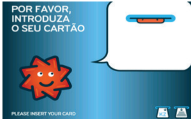
1. Introduzir o Cartão Multibanco