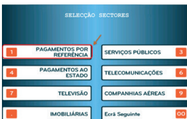
4. Escolher “Pagamentos por Referência”