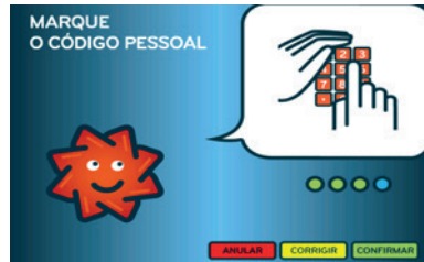
2. Marcar o Código Pessoal