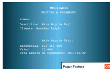
8. No quadro onde está descrito o Plano de Saúde Mais Angola Light e o nome do cliente, escolher a opção “Pagar Factura”