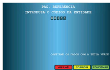
5. Colocar a Entidade mencionada no SMS e carregar no botão verde “Confirmar”