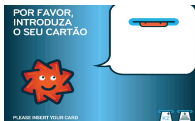
1. Introduzir o Cartão Multibanco