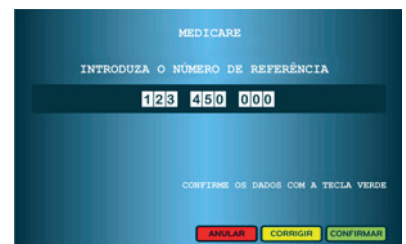
6. Colocar a Referência mencionada no SMS e carregar no botão verde “Confirmar”