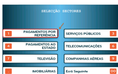
4. Escolher "Pagamentos por Referência"