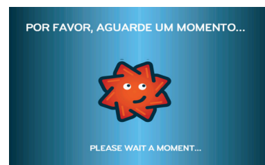
9. Pagamento fica efectuado