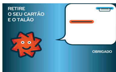
10. Retirar o Comprovativo de Pagamento e o Cartão