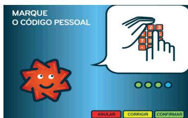
2. Marcar o Código Pessoal