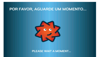
9. Pagamento fica efectuado