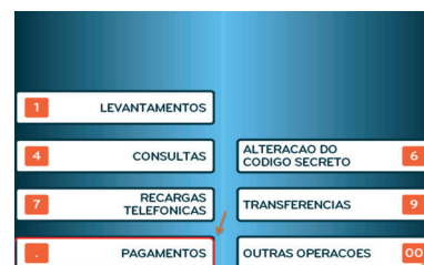
3. Escolher "Pagamentos"