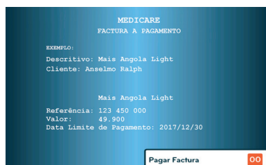
7. Escolher o quadro com o valor 49.900 Kwz