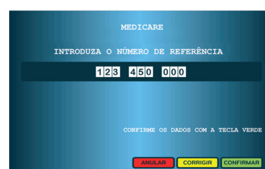
6. Colocar a Referência mencionada no SMS e carregar no botão verde "Confirmar"