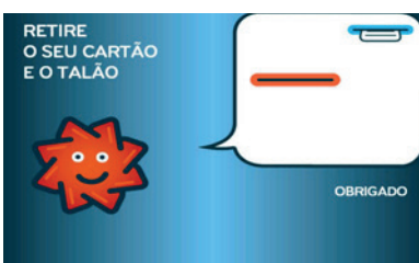
10. Retirar o Comprovativo de Pagamento e o Cartão